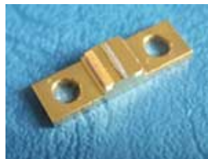
Abb.2: Bei der verwendeten SLD ist der Halbleiter-Rippenwellenleiter, in dem die Lichterzeugung aufgrund von verstärkter spontaner Emission durch Rekombination von elektrisch injizierten Elektronen und Löchern in den Quantenpunkten erfolgt, gut zu erkennen.

Die Untersuchung von Intensitätskorrelationen wurden schon im Rahmen des berühmten Hanbury-Brown-Twiss-Experiments (HBT) durchgeführt, wo in einem Michelson-Interferometer-Aufbau die Photonenkorrelationen zwischen den Intensitäten in den beiden Interferometerarmen bestimmt wurden. Dabei zeigte sich, dass die Kohärenzeigenschaften zweiter Ordnung von Lasern und thermischen Quellen unterschiedlich sind, selbst wenn die Kohärenzeigenschaften erster Ordnung, also das Spektrum gleich sind. Im Detail bedeutet dies, dass der Laser eine zentrale (also bei Verzögerung \tau = 0 ) Korrelationsfunktion zweiter Ordnung von g^{(2)}(\tau = 0) gleich 1 besitzt, das heißt, die Emission erfolgt in Form eines vergleichsweise regulären, geordneten Photonenstroms, wohingegen thermische oder inkohärente Strahlung „Photon Bunching“, also die Emission von „Photonenklumpen“ aufweist. Sie besitzt deshalb ein g^{(2)}(\tau = 0) gleich 2, was zu Beginn als kontraintuitiv betrachtet und daher recht kontrovers diskutiert wurde. Daraus entwickelte sich letztlich das Paradigma, dass nämlich die spektral breitbandige, inkohärente Emission einer thermischen Quelle immer mit einer erhöhten zentralen Intensitätskorrelation von verbunden ist, während der Laser eine solche von eins aufweist.